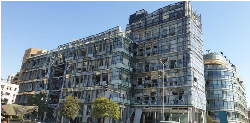
Zerborstene Scheiben und völlig zerstörte Hausfassaden. Alleine kann der Libanon die großflächige Zerstörung nicht bewältigen.