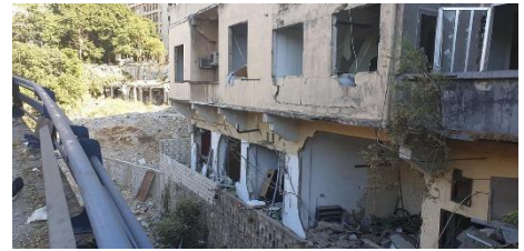
Die Schäden in Beirut erstrecken sich weit über den Hafen hinaus.